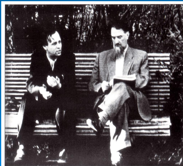
И.В. Курчатов и А.Д. Сахаров. 1958 г.