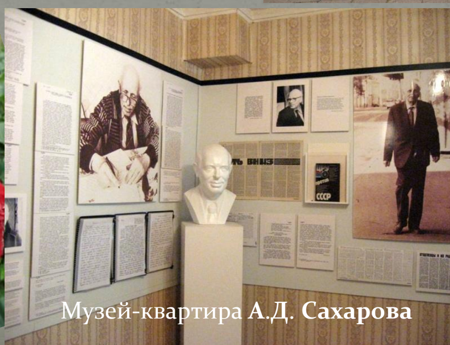
Музей-квартира А.Д. Сахарова