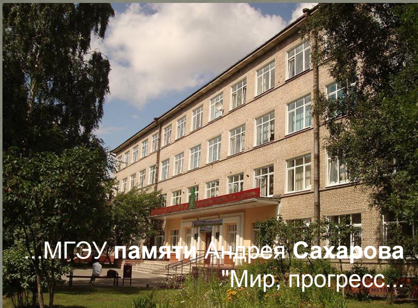
...МГЭУ памяти Андрея Сахарова "Мир, прогресс..."