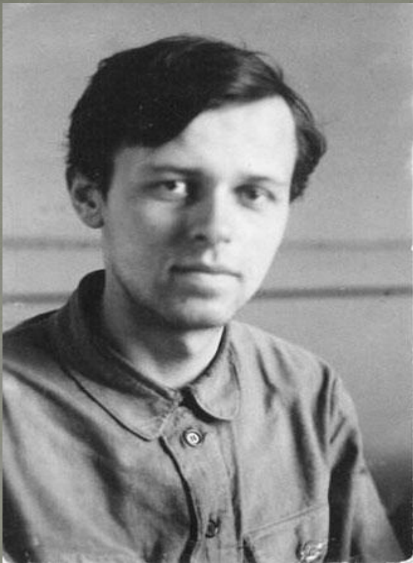
А.Д.Сахаров. Конец 40-х годов.