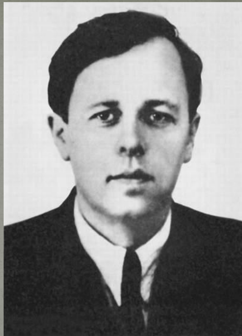
А.Д.Сахаров - сотрудник КБ-11. 50-е годы