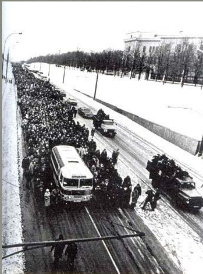
1989г. Похороны А.Д. Сахарова. На пути в Лужники.