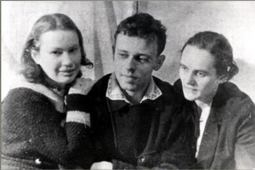
А.Сахаров с двоюродными сёстрами

В 1942 г. Андрей Сахаров с отличием окончил МГУ. Ему была присвоена квалификация научного работника в области физики, преподавателя ВУЗа и ВТУЗа и звание учителя средней школы.